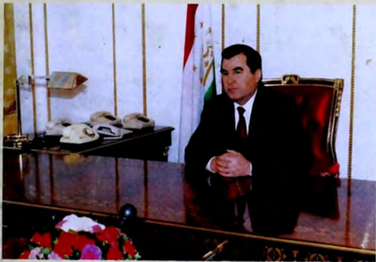
ПРЕЗИДЕНТИ ҶУМҲУРИИ ТОҶИКИСТОН ЭМОМАЛӢ РАҲМОҶОВ